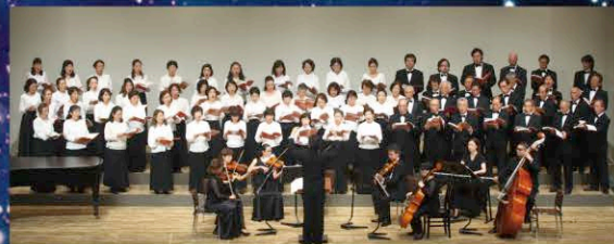
混声合唱団CANORA / 町田シティオペラフィルハーモニー